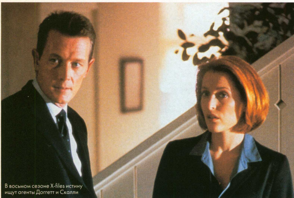
В восьмом сезоне X-Files истину ищут агенты Доггетт и Скалли

14 сентября канал REN TV начинает премьерный показ 8-го сезона «Секретных материалов». Ты все лето ждал этого момента! Это же ПОСЛЕДНИЙ сезон для агента Малдера! И ПЕРВЫЙ для нового агента Доггетта! Дэвид Духовны уже не Малдер. Но привычка задавать вопросы (с целью установить истину) у него осталась. Лови файлы его допроса Джиллиан Андерсон (агент Скалли) и Роберта Патрика (агент Доггетт). Духовны — следователь, МОЛОТОК ведет протокол.